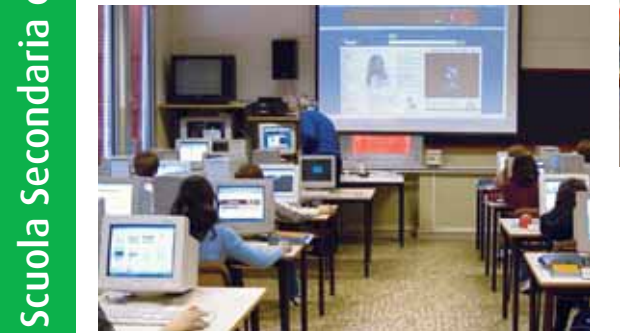
Laboratorio di informatica: con 29 postazioni, sistema di videoproiezione, TV con antenna satellitare. Tutte le aule sono connesse alla rete del laboratorio e all'ADSL. L'attività coinvolge tutte le classi dell'Istituto.

ISCRIZIONE Sono previsti due incontri rivolti ai genitori degli alunni delle classi quinte nei giorni: mercoledì 9 gennaio 2008, ore 18.00 lunedì 14 gennaio 2008, ore 18.00 Saranno illustrati l'organizzazione della Scuola, le attività didattiche programmate, i criteri di formazione delle classi prime e le modalità di iscrizione. Gli incontri si terranno presso la sede della scuola in Via Conciliazione, 75.