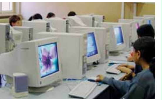
Nuovo laboratorio di informatica con 20 postazioni in rete

Educazione alla cittadinanza Partecipazione al Consiglio Comunale dei Ragazzi Incontri con Istituzioni e Volontariato Alfabetizzazione Progetto in rete con le altre scuole del Comune di Mantova per alunni stranieri Attività pomeridiane aggiuntive - Gruppo sportivo - Aiuto compiti. Due rientri, mercoledì e venerdì, per gli alunni che necessitano di un supporto nello studio.