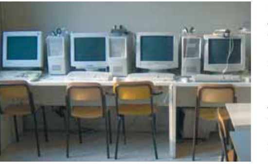
Laboratorio Recupero disturbi specifici dell'apprendimento