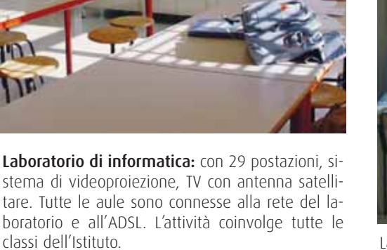
Laboratorio di informatica: con 29 postazioni, sistema di videoproiezione, TV con antenna satellitare. Tutte le aule sono connesse alla rete del laboratorio e all'ADSL. L'attività coinvolge tutte le classi dell'Istituto.

Scienze: il laboratorio è dotato di una ricca strumentazione per esperimenti di BIOLOGIA-CHIMICA-FISICA e di sussidi per lo studio del corpo umano. Fiore all'occhiello gli STEREOSCOPI per una visione tridimensionale e molto ingrandita di oggetti piccolissimi.