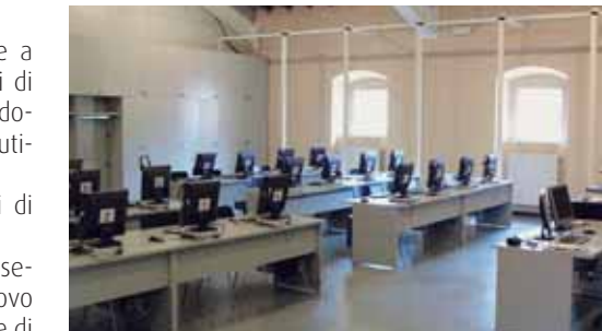
Nuovissimo laboratorio linguistico

mati hanno come obiettivo la conquista della propria identità, della conoscenza dell'ambiente in cui si vive e delle opportunità offerte dalle scuole superiori e del mondo del lavoro. Progetti di sviluppo delle competenze scientifiche attraverso percorsi di approfondimento della conoscenza del territorio e dell'ambiente. Corsi di educazione stradale finalizzati all'acquisizione di un corretto comportamento sulla strada e conseguentemente all'acquisizione del patentino per la guida del ciclomotore. Percorsi facoltativi extracurricolari - gruppo sportivo pomeridiano - corso di sacchi - corso di chitarra e di strumenti a fiato e batteria Attività di alfabetizzazione per gli alunni stranieri. Partecipazione al Consiglio Comunale dei Ragazzi. Il Dirigente scolastico e i docenti incontreranno i genitori degli alunni delle classi quinte, per una dettagliata presentazione della scuola e delle proposte educative e didattiche, mercoledì 19 dicembre 2007 e martedì 22 gennaio 2008 alle ore 17,30 nell'auditorium della scuola media "Sacchi" in via Gandolfo 17/a.