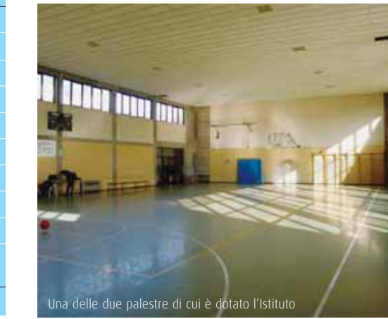
Una delle due palestre di cui è dotato l'Istituto